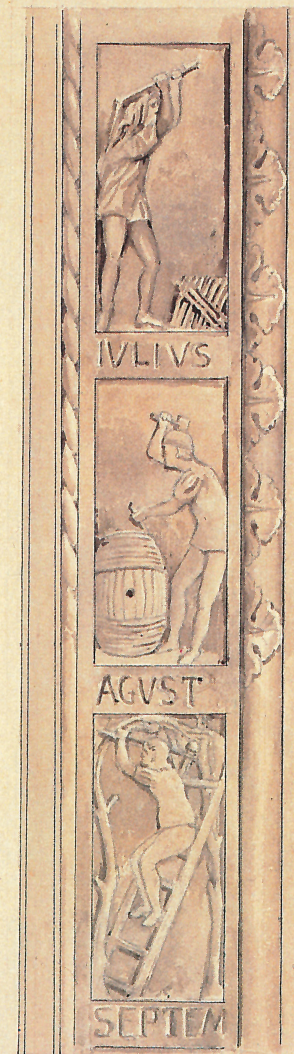
DETTAGLIO A Scala di cent. 40 per metro