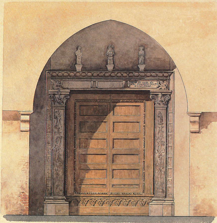
Scala metrica di \frac{1}{20}